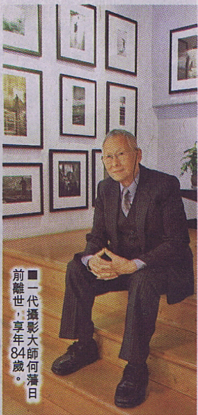
一代攝影大師何藩日前離世，享年84歲。