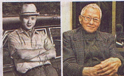
何藩年輕照及近照

以捕捉 1950 同 1960 年代香港街景為人熟悉、國際知名攝影大師何藩，周日（19日）因為肺炎惡化，喺家人陪伴下於美國加州一間醫院辭世，享年 84 歲。何藩家人嗰日透過公關公司發表聲明，對於至親畢生成就同對社會嘅貢獻，感到莫大光榮，而何藩嘅葬禮將會以私人形式舉行。